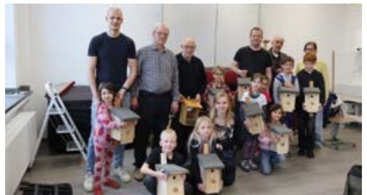
Workshop im Haus der Bildung (Kurs 261-2601).

Wenige Tage später fand im Haus der Bildung, der Volkshochschule Kamen-Bönen, ein Familienworkshop zum gleichen Thema statt. Auch hier bauten Kinder gemeinsam mit ihren Eltern und unterstützt durch Helfer*innen aus zugeschnittenem, unbehandeltem Holz individuelle Nistkästen.