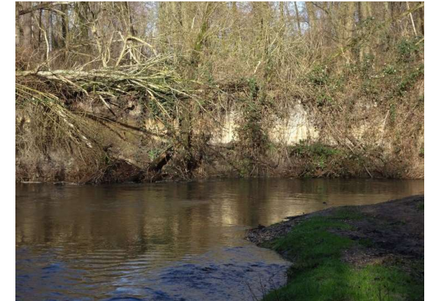
Steilwanden aan de Worm Prallhänge an der Wurm (Peter Kuhn)

Bei Hochwasser wird alles überschwemmt, dann stürzen auch mal die alten Bäume (Weiden, Pappeln) um. Sie bleiben als Totholz liegen und bieten vielen Tieren einen guten Unterschlupf. Aber irgendwo wachsen wieder neue Bäume und Sträucher. Die Menschen kümmern sich nicht darum. Deshalb ist es so schön hier.