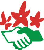
Bild 3: Zusatz-Liste der NaturFreunde NRW und Naturfreundejugend NRW