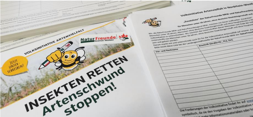
Bild 4: Zusatz-Liste der NaturFreunde NRW und Naturfreundejugend NRW